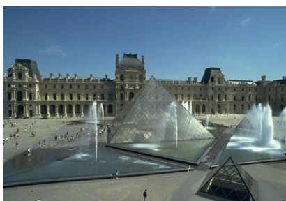
À gauche, vue de la cour du Louvre avec sa fameuse pyramide. À droite, les vestiges du frigidarium des thermes de Lutèce (Musée de Cluny).

En 2015-2016, les latinistes partent à la découverte du Paris antique au mois de mars. Ils iront découvrir des œuvres antiques ou en lien avec la culture antique au musée du Louvre. L'après-midi, ils partiront à la recherche des traces archéologiques dans le quartier latin, en particulier avec la visite du Musée de Cluny qui est construit sur les vestiges des thermes antiques de Lutèce. La visite se terminera par la découverte des souterrains du musée qui constituaient les canaux d'arrivée et d'évacuation de l'eau des thermes.